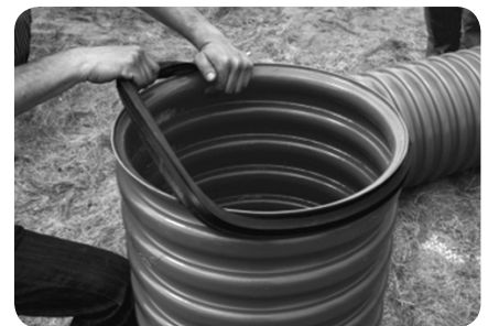
Figur 3. Tætningsring placeres.