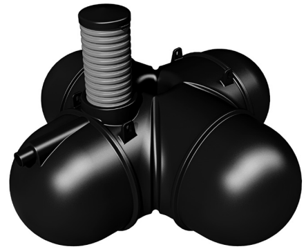
Figur 1. Samletank 3000 L PE.